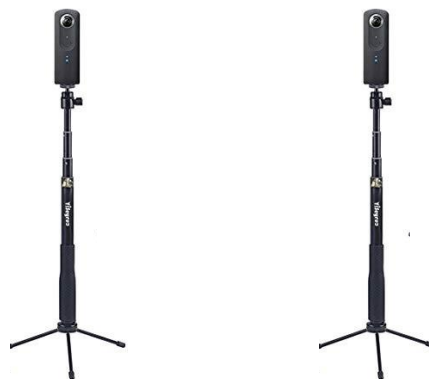
360°カメラを一脚につけた図